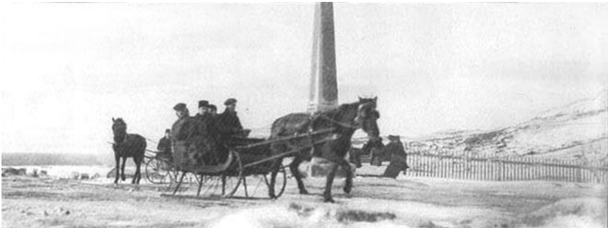
Promenade du Ministre, du Gouverneur et du maire de Saint-Pierre, sur la route Iphigénie, par 20° au-dessous de zéro.

On ne lit guère, à Saint-Pierre, que des journaux du Canada ou des États-Unis. Or ces journaux, depuis plusieurs mois, annonçaient que la France, pour payer ses dettes à ses alliés, se disposait à aliéner certaines de ses colonies et notamment les îles de Saint-Pierre et Miquelon. Le voyage du ministre n'avait-il pas pour objet de préparer les habitants à cette cession et d'en régler les conditions sur place ? Voilà ce que pensaient les Saint-Pierrais, et leur soulagement fut grand quand, le soir même de son arrivée, M. Sarraut dissipa le malentendu en affirmant que la France, non seulement ne songeait pas à les vendre, mais voulait resserrer les liens qui les attachent à elle en s'efforçant d'assurer leur prospérité. A peine cette déclaration faite, l'enthousiasme succéda à la froideur, et c'est au milieu d'ovations incessantes que le ministre, pendant trois jours, visita les îles et leurs établissements.