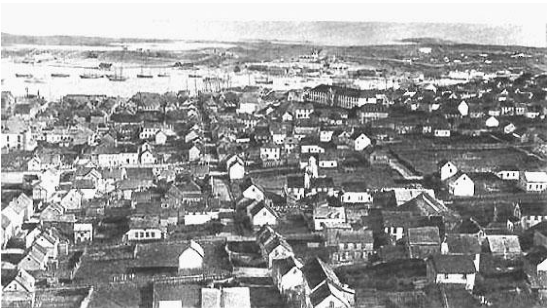
Vue générale de Saint-Pierre : une partie de la ville et le port du Barachois

Une fois bien sèche, la morue est pressée dans des boucauts ; c'est ainsi qu'elle est expédiée dans les pays consommateurs, à la fin de la saison de pêche.