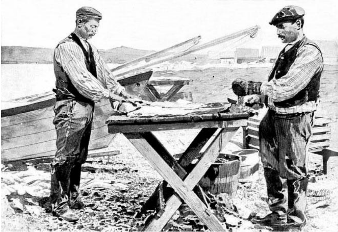
Le « tranchage » du poisson, à terre.

On appelle grève la plage, entièrement recouverte de pierres plates apportées là à main d'hommes, sur laquelle on étend les morues, ouvertes en éventail par les pêcheurs. Cette tâche est assez délicate, car il faut, pour que le séchage s'effectue dans de bonnes conditions, une température égale et douce. Que le temps se refroidisse, que le brouillard s'élève, et voilà les grâviers ou les femmes des pêcheurs saint-pierrais obligés de ramasser en hâte leur poisson sous peine de le voir se gâter et ne donner qu'un produit défectueux. Pour remédier à cet inconvénient, on a essayé du séchage à la vapeur, et un armateur de Saint-Pierre a réalisé toute une installation modèle ; mais l'exemple n'a pas été suivi, et longtemps encore, on verra courir sur la grève , pêle-mêle, les femmes de Saint-Pierre et les petits Bretons.