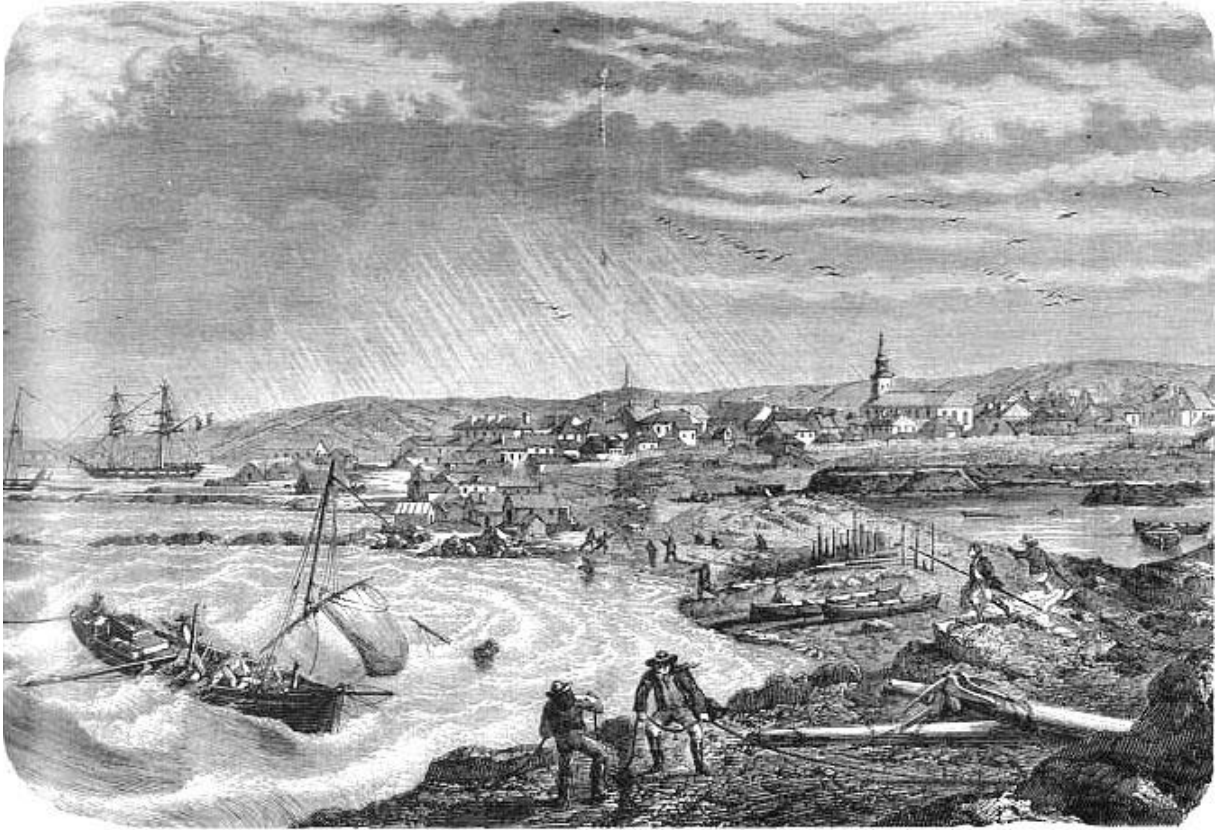
PÊCHE DE LA MORUE - LA VILLE DE SAINT-PIERRE MIQUELON, A TERRE-NEUVE